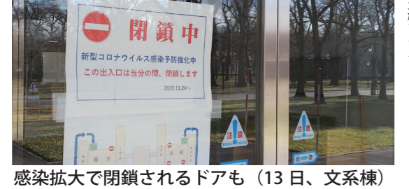
感染拡大で閉鎖されるドアも(13日、文系棟)

新型コロナウイルスの感染拡大防止を維持するに当たって、本学の教育や研究、学生の部活動などの制限が再強化されている。