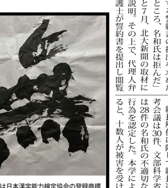
※今年の漢字は日本漢字能力検定協会の登録商標